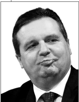
Mappus muss weg

alle Städte und alle Gemeinden in unserem Land werden wegen der Finanzkrise mit weniger Steuereinnahmen und Steuerzuweisungen zu kämpfen haben.